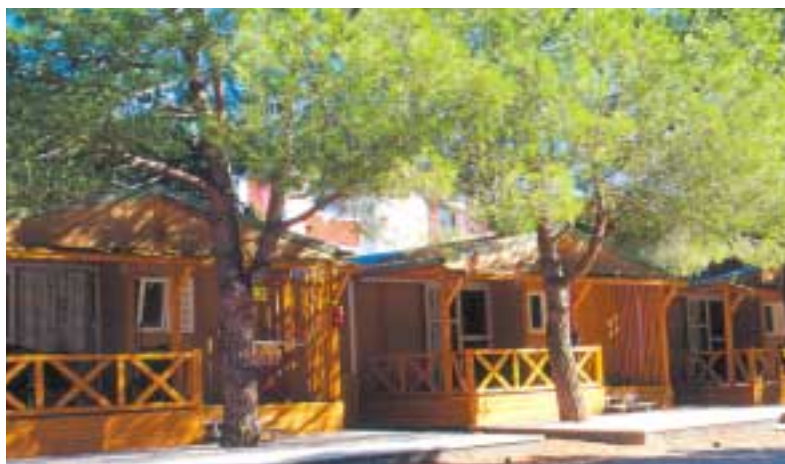
Prezzi giornalieri per bungalow