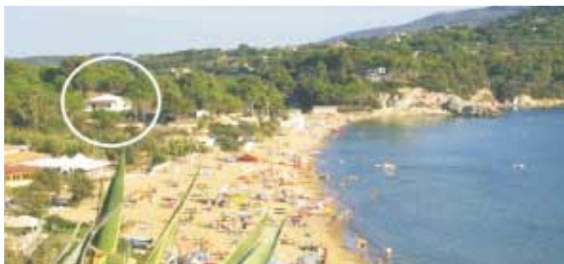
Prezzi giornalieri per appartamento

Gli appartamenti Lido sono direttamente sul mare al centro della splendida spiaggia di sabbia del Lido di Capoliveri, all'interno del Camping Lido gestito dai proprietari e distante soli 8 Km da Portoferraio e 3 da Porto Azzurro e Capoliveri. I bilocali e trilocali, tutti appena ristrutturati, dotati di TV color e aria condizionata con giardino e parcheggio privato ad appena 20 metri dalla spiaggia. Bar, ristorante-pizzeria, market ed edicola a 100 mt. Noleggio barche, campo boe per ormeggio natanti, noleggio sdraio e ombrelloni, scuola di surf e tante altre attività sportive. Parco giochi per bambini. Diving convenzionato direttamente in loco. Maneggio e tennis a circa 500 metri.