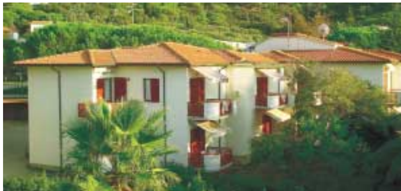
Prezzi giornalieri per unità abitativa

All'interno del Camping Village Le Calanchiole (vedi pag. 63) il Residence Villa Angelica, a pochi passi dalla splendida spiaggia del Lido di Capoliveri, dispone di appartamenti, con bagno, cucina, terrazzo, giardino, TV-SAT, cassaforte, aria condizionata e parcheggio riservato. Possibilità di usufruire dei servizi del camping. Tessera club presso il campeggio inclusa nel prezzo.